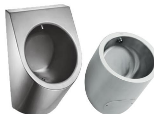
WC wiszące i stojące